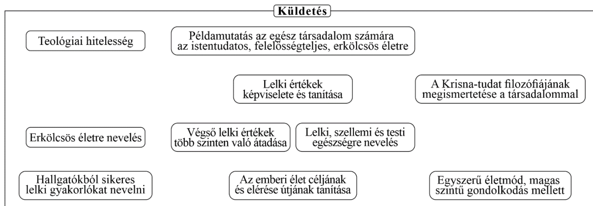
1. ábra A Főiskola küldetésének elemei